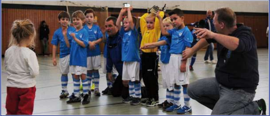
Die „blau weißen Delfine“ beanken sich bei den Fans !